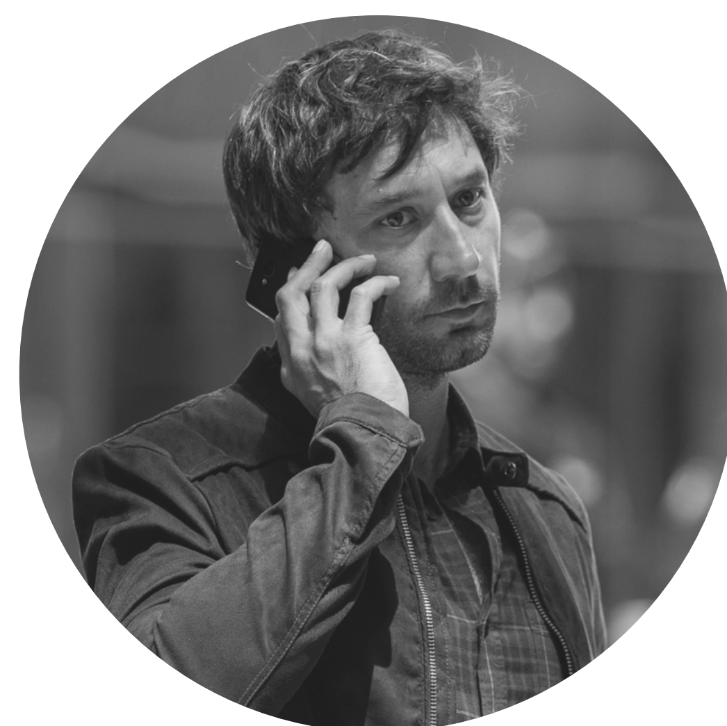
ROBERTO RAÚL FERNÁNDEZ

Jefe de Grupo de Fuentes. Experto “manipulador” de fuentes. Un profesional con don de gentes, capaz de convencer y motivar a sus colaboradores. Está muy atento a tener separado trabajo y vida personal... Hasta que conoce a Amina.