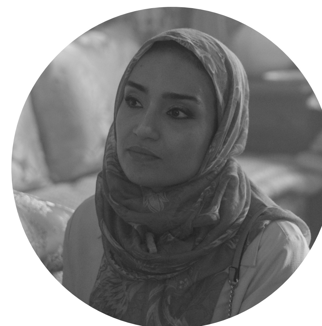
AMINA AMINA LEONY

Comisario General de Información de la Policía Nacional. Es el más alto cargo de la Policía y a quien la Unidad debe rendir cuentas.