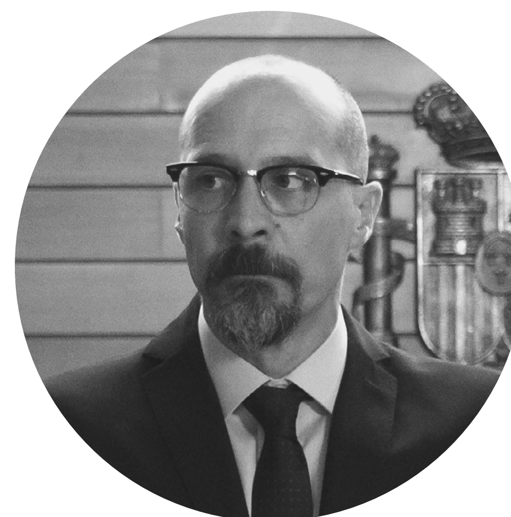
SANABRIA FELE MARTÍNEZ

Comisario General de Información de la Policía Nacional. Es el más alto cargo de la Policía y a quien la Unidad debe rendir cuentas.